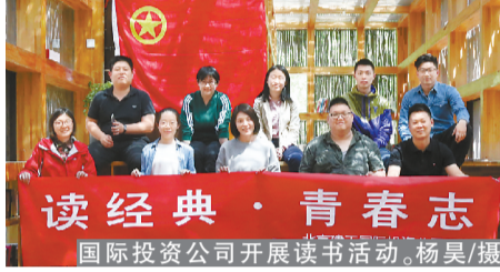
国际投资公司开展读书活动。