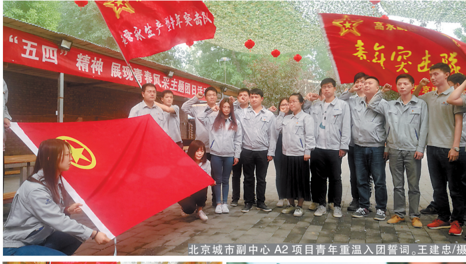
北京城市副中心A2项目青年重温入团誓词。

过程中,大家克服困难、互相扶持,共同缓解跑步中的疲劳,一起向前进发。此次活动使项目部员工锻炼了体魄,增强了团队协作和全民健身意识,并为“奔月计划”贡献了70公里。 此外,在“天舟一号”发射当天,由于项目部距离发射观测点近,便在路边架设望远镜,专门为前来观赏火箭升空过程的游客指路,大大缓解了人流量激增带来的交通拥堵问题,得到了游客和当地百姓的一致好评,使建建品牌在海南本地更加响亮。