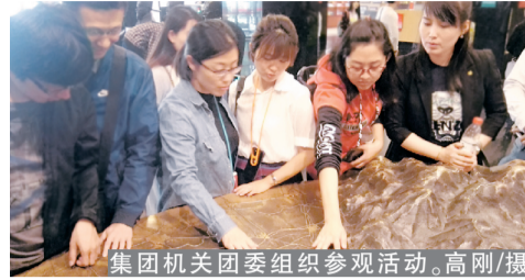
集团机关团委组织参观活动。