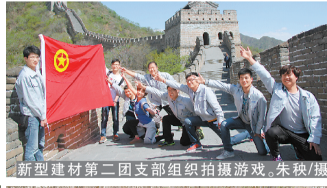
新型建材第二团支部组织拍摄游戏。