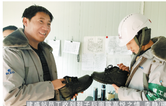
建盛站员工收到鞋子后面露喜悦之情。