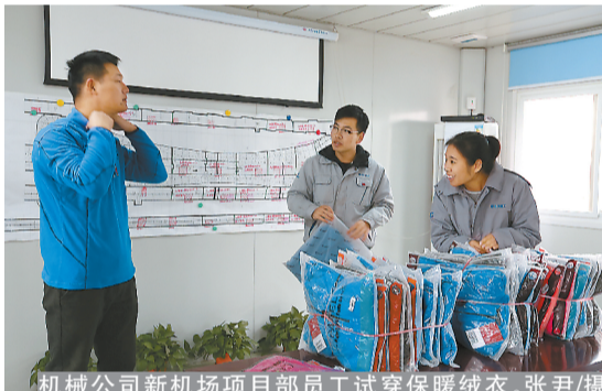
机械公司新机场项目部员工试穿保暖绒衣。