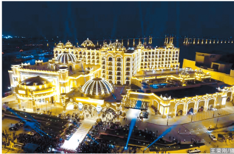
在安全文明施工和保证工程质量方面,项目部投入了大量人力物力...