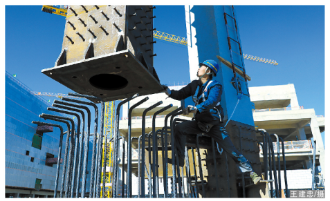
6号楼钢结构施工是在建设单位、设计公司、设计与施工单位科学计划、严格施工、同心协力、密切配合中进行的...