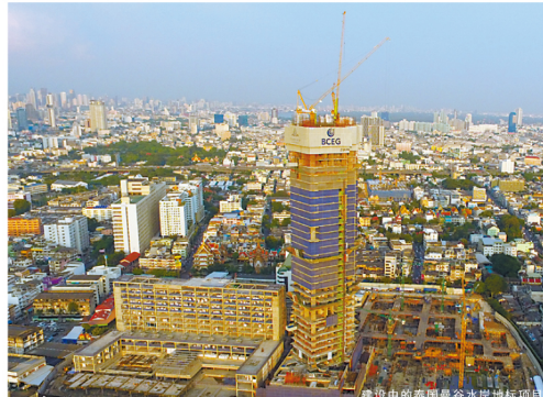
建设中的泰国曼谷水滨地标项目

作为目前泰国在建项目中最高的建筑,和第一个项目外超过300米同时是也境外最高的建筑,项目履约一直考验着团队的智慧和决心。2015年,在工程主体结构浇筑任务过程中,项目团队创造了一次性完成浇筑8米厚,共12000立方米的墙体混凝土,成为泰国之最。在73层的主体四季酒店公寓楼施工中,项目团队为了一个目标加班加点工作,保证了5层全一层的施工进度。